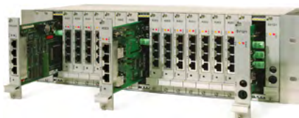
Exemple d'un modèle version II 19 pouces entièrement équipé