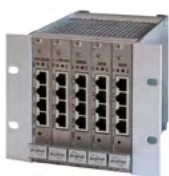
Exemple d'une unité de base I 19 pouces

L'IDT 32 est une unité de gestion moderne et High End, pouvant convenir de manière flexible aussi bien à des applications de contrôle d'accès, de gestion des alarmes, de détection incendie que des applications vidéo. De conception modulaire, l'IDT 32 dispose de 1 à 21 slots pour répondre précisément aux exigences du client tout en restant simple d'installation par le principe Plug-and-Play.