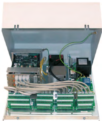
Unité de base III entièrement équipée (boîtier pour pose au mur)